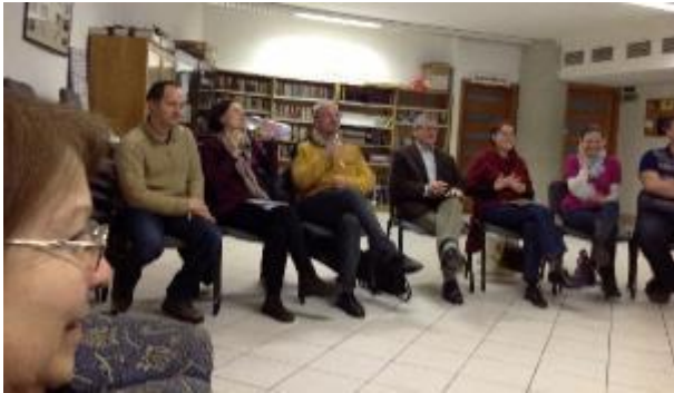
Parejas que asistieron en la reunión