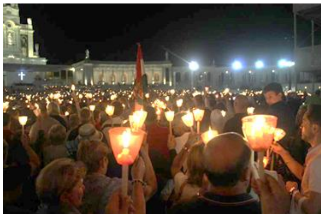
Momentos durante el video – foro

Durante el Encuentro todos los días se reza el rosario en familia y el rosario de antorchas con la comunidad.