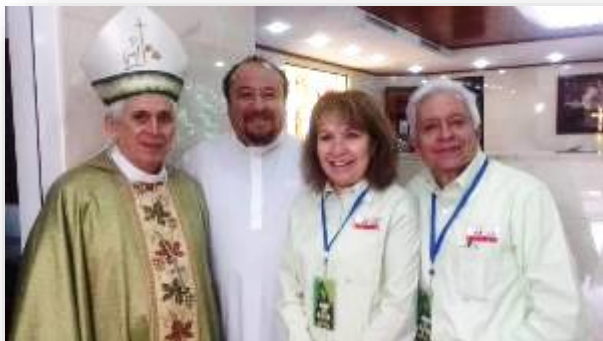
Arriba: Equipo Presidente de la CIMFC con Mons. Grullón.