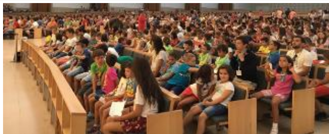
Grupo de niños

Durante el Encuentro todos los días se reza el rosario en familia y el rosario de antorchas con la comunidad.