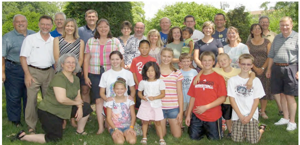
Miembros de la Junta Directiva de los E.E.U.U. y sus familias reunidos para una fotografía en la Reunión de Verano 2011 de la Junta Directiva en el Centro Cabrini, Chicago.

NORTE AMÉRICA Canadá Estados Unidos MFC USA MFCC MFC LA