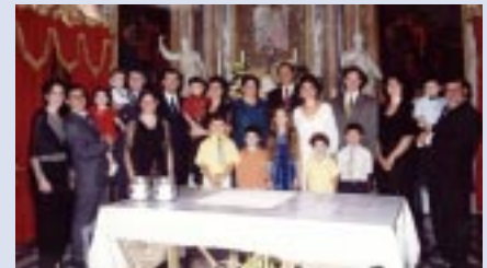
El Gauci clan

familiar y el diálogo familiar emefecista.