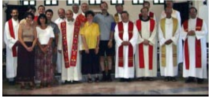
Encuentro de Padres, Hungría