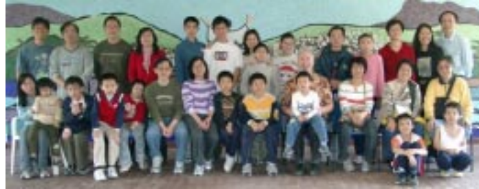
Movimiento Familiar en Hongkong

Tuvimos una cálida recepción en Seúl. Los Representantes del MFC de Corea nos