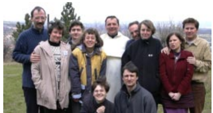
Encuentro de Comprometidos, Ucrania