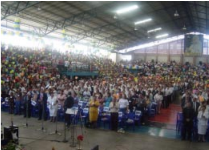
El Salvador Reunion