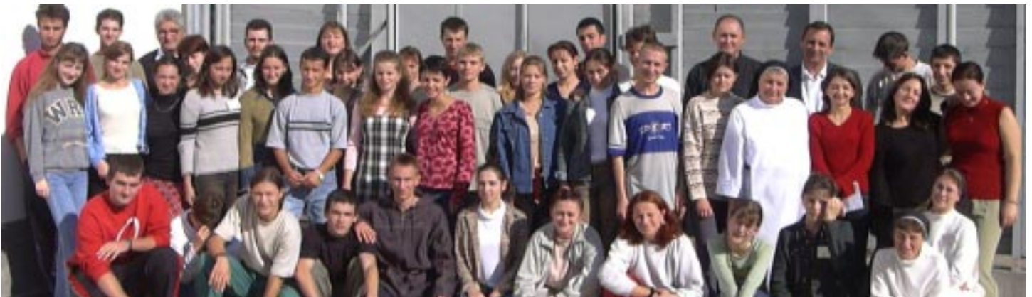
Encuentro de Hijos y Hijas, Ucrania