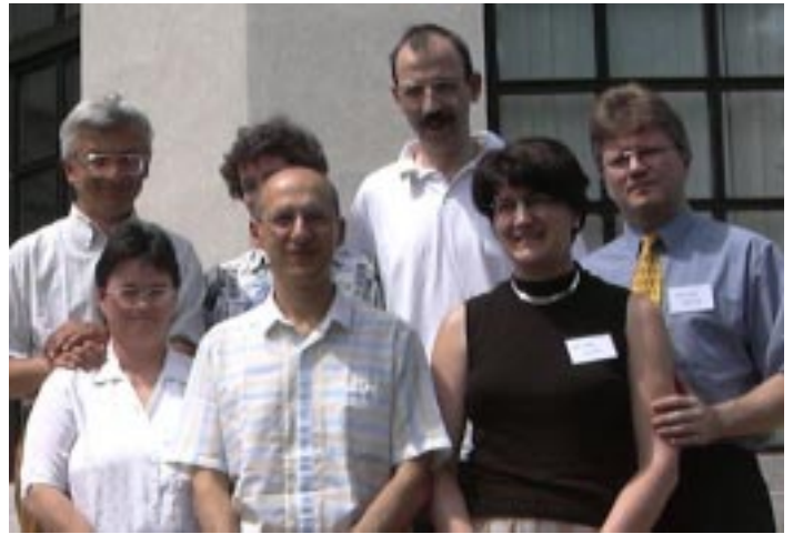
Encuentro Matrimonial, Hungría