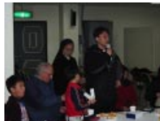
Movimiento Familiar en Korea

La reunión en nuestro hogar fue vibrante, interesante y llena de promesas. P.