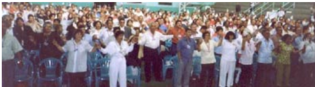
PARTICIPANTES del ELA rezando y alabando juntos

Es muy amable de su parte sus favorables comentarios relacionados a los resultados de Maceió. Actualmente las versiones tanto en español como inglés están listas desde hace más de un año, pero la falta de dinero para hacer las copias