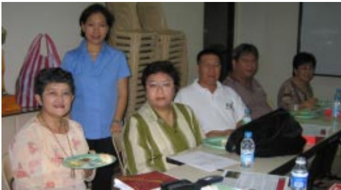
FIRES en el Filipinas