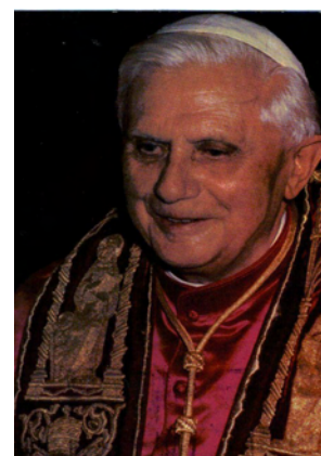
S.S. Papa Benedicto XVI