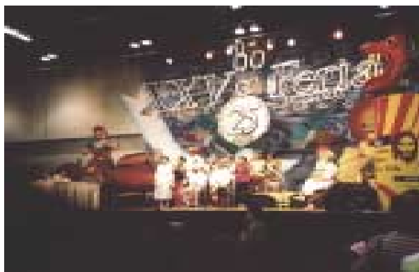
Una ocasion a disfrutarnos de una Panama Festival de Artes