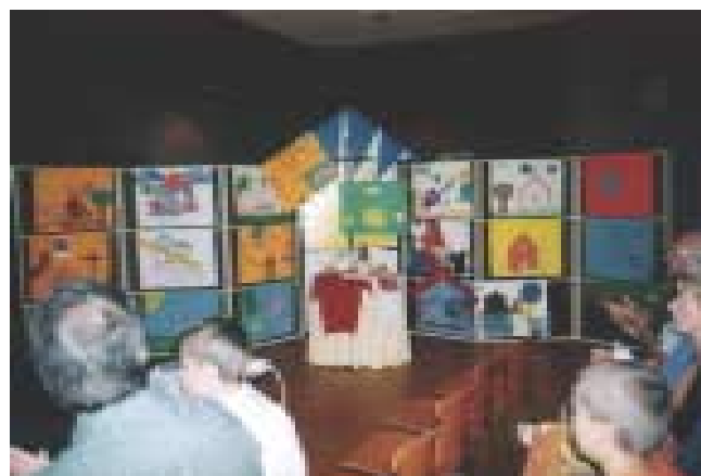
Grupo de póteres expresando, "Dios está en nuestro hogar" despues de la Convencion