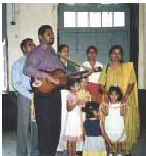
El Coro del MFC